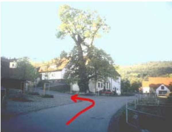
Bild 3: In Haselbach biegen Sie bitte an der großen Linde links ab. Nach einem Kilometer bergauf führt ein Weg rechts direkt in die Einfahrt der Gästehäuser Hohe Rhön.