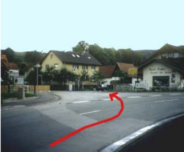
Bild 2: Beim Sportgeschäft Walter biegen Sie von der Kreuzbergstraße links nach Haselbach ab.