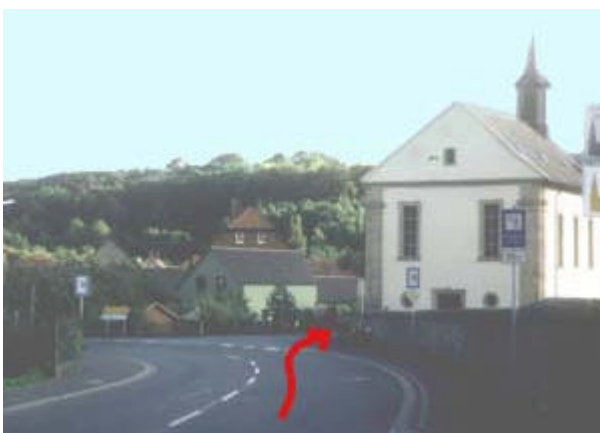
Bild 1: Die Abzweigung in Richtung Kreuzberg und Haselbach. Bitte an der Friedhofskapelle rechts abbiegen.